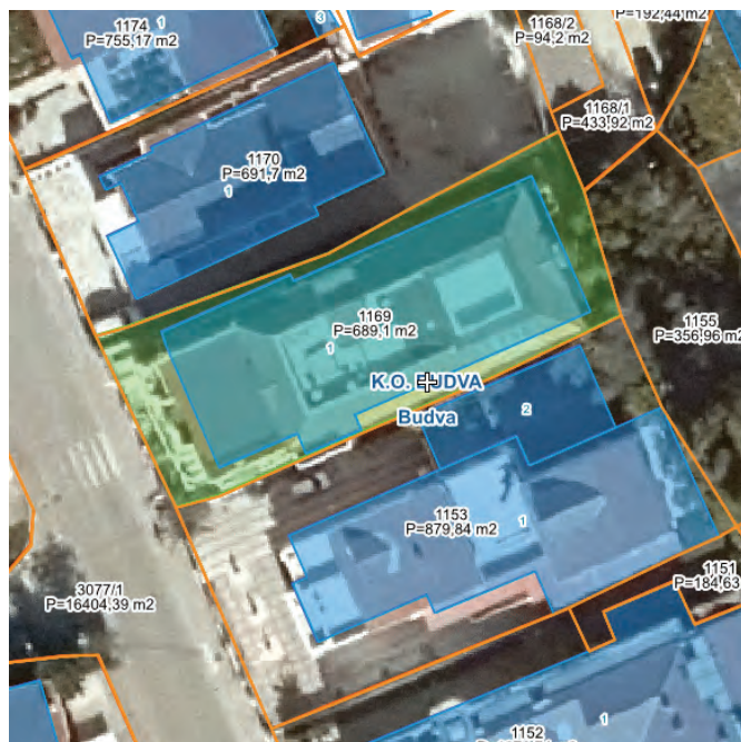
Prikaz katastarske parcele i zgrade

OPŠTINA-----BUDVA KATASTARSKA OPŠTINA-----KO BUDVA POVRŠINA NEKRETNINE-----316m 2 CIJENA NEKRETNINE U EUR-----NA ZAHTJEV ID BROJ-----ME10186B01001